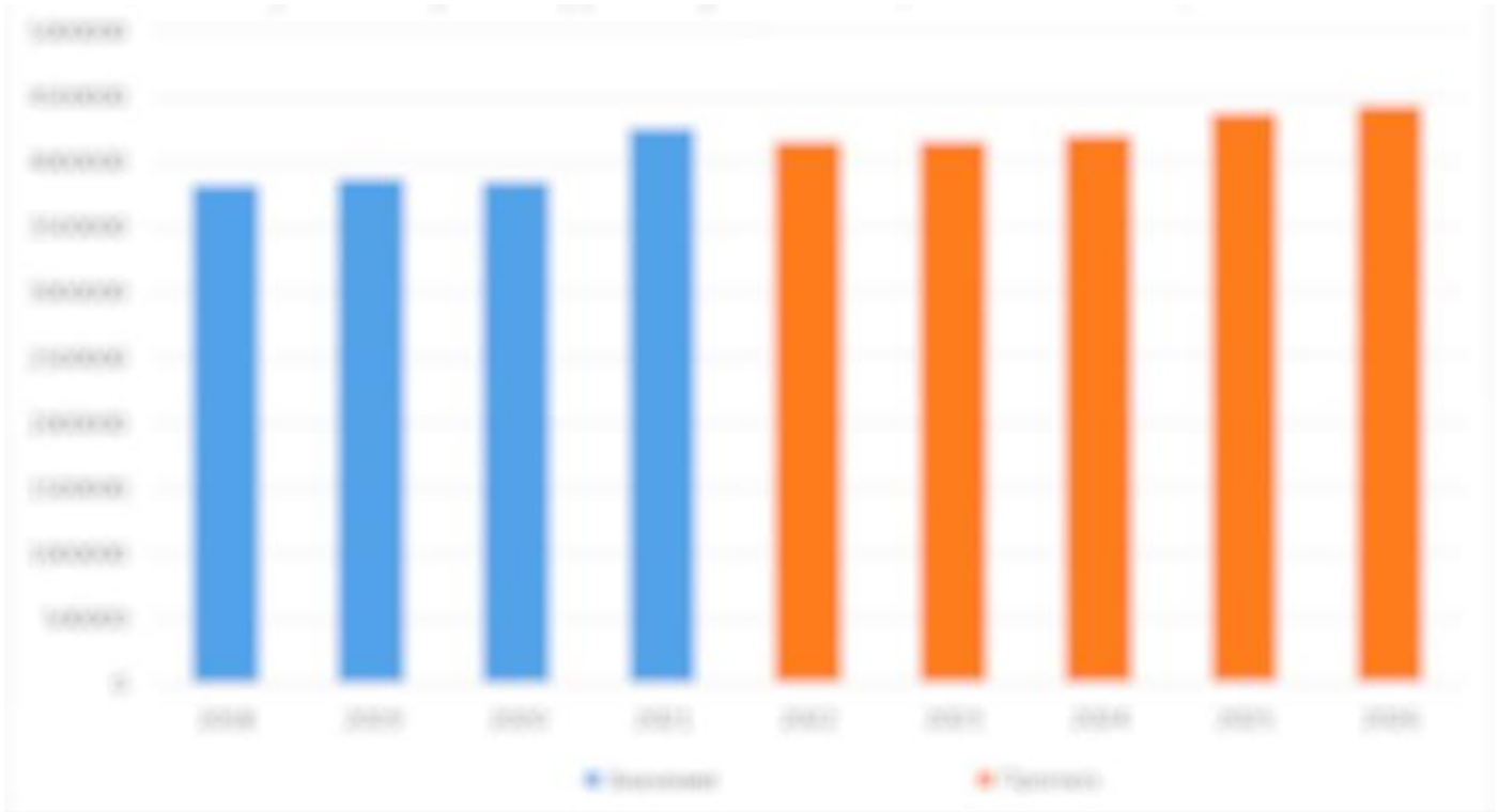
График 1. Прогноз объёмов рынка БАД в России до 2026 г., тыс. тонн

*прогноз составлен на основе метода экспоненциального сглаживания