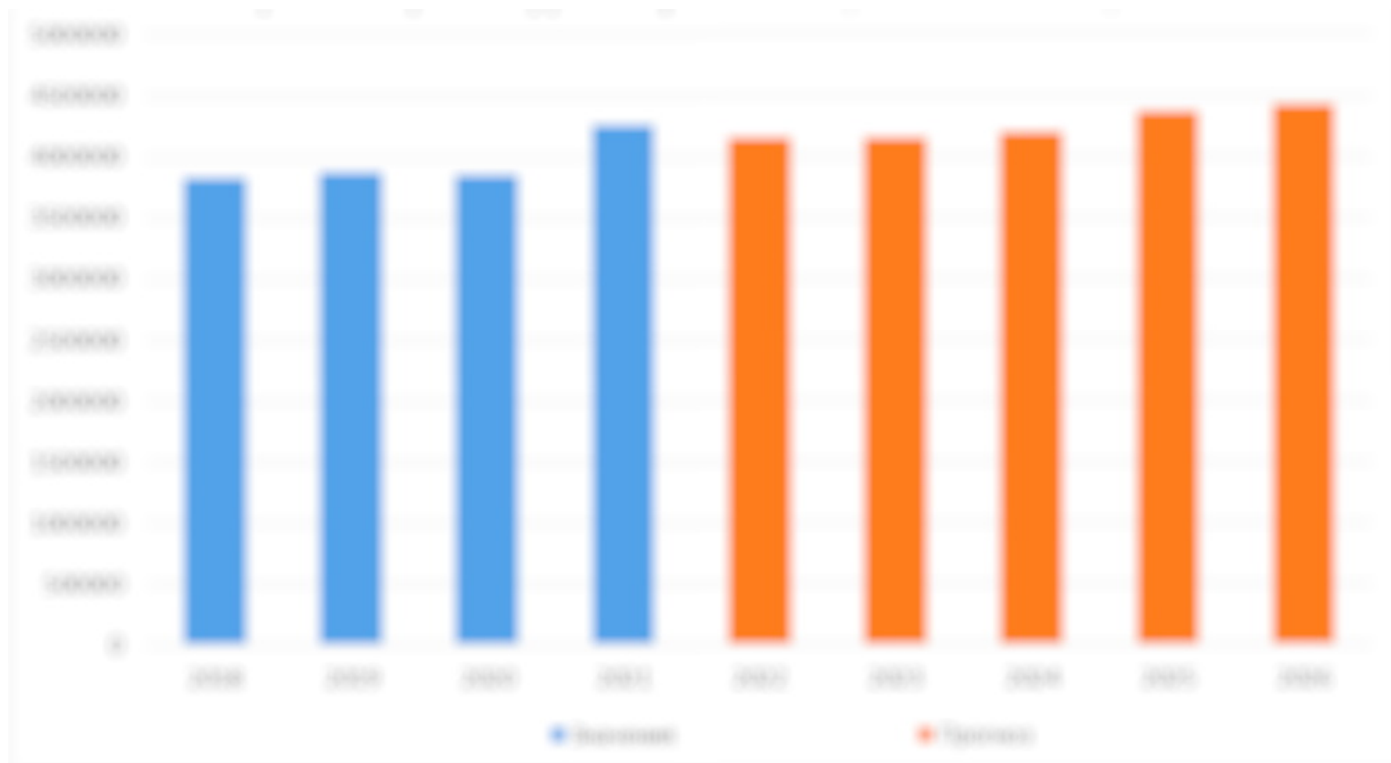
График 1. Прогноз объема рынка медицинского оборудования в РФ, 2022 - 2026 гг., тыс. руб.

Источник: собственные расчеты ЭКЦ «Инвест-Проект»