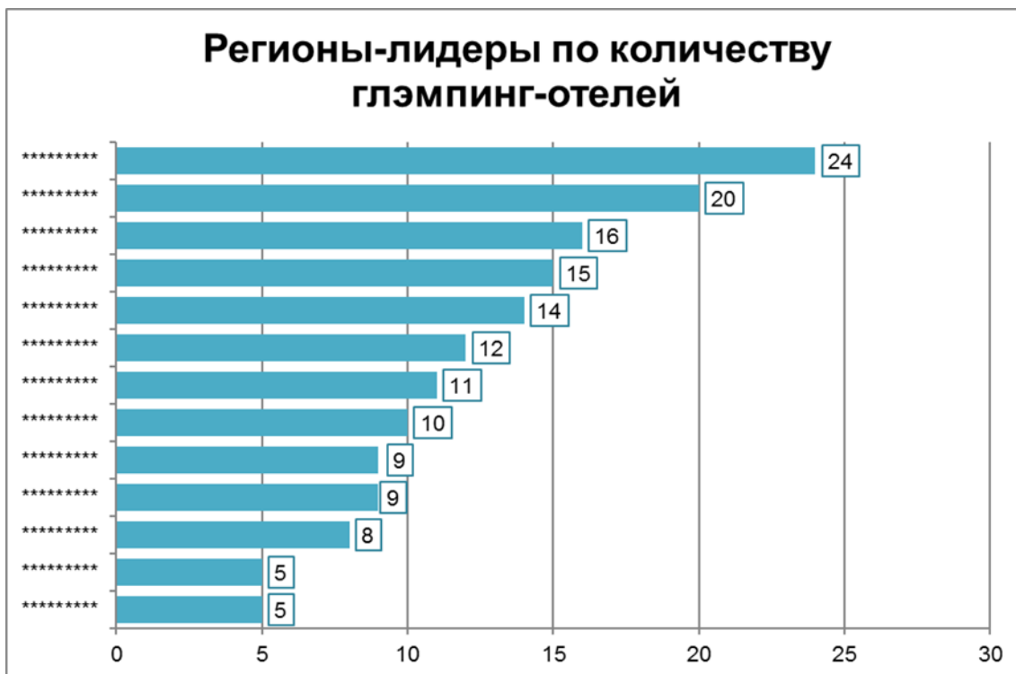
Диаграмма 1. Регионы-лидеры по количеству глэмпинг-отелей, 2022 г.

***% глэмпингов функционируют круглогодично. ***% глэмпингов используют только один тип жилых модулей.