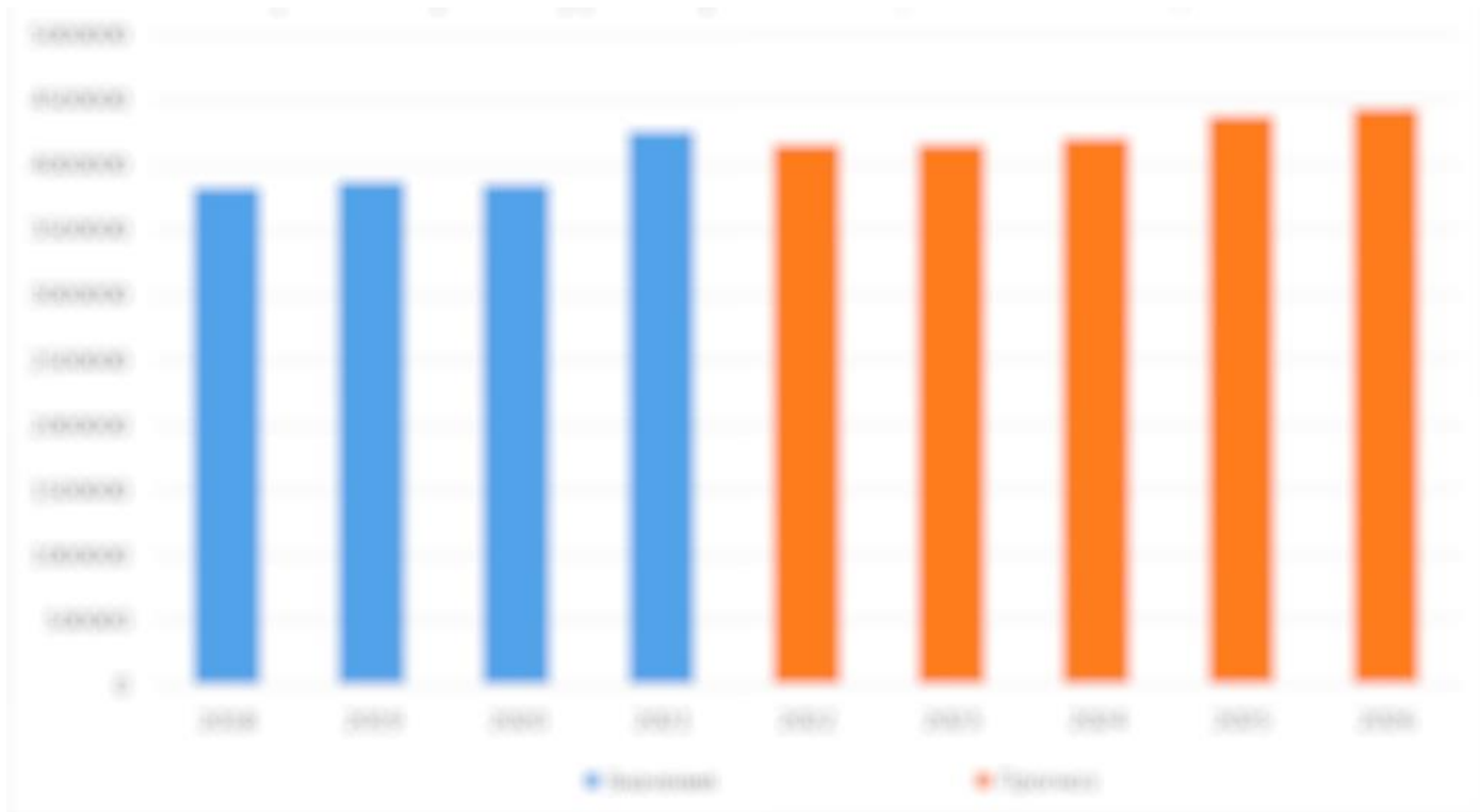
График 1. Прогноз производства двигателей внутреннего сгорания в РФ, 2022 - 2026 гг., шт.

Источник: собственные расчеты ЭКЦ «Инвест-Проект»