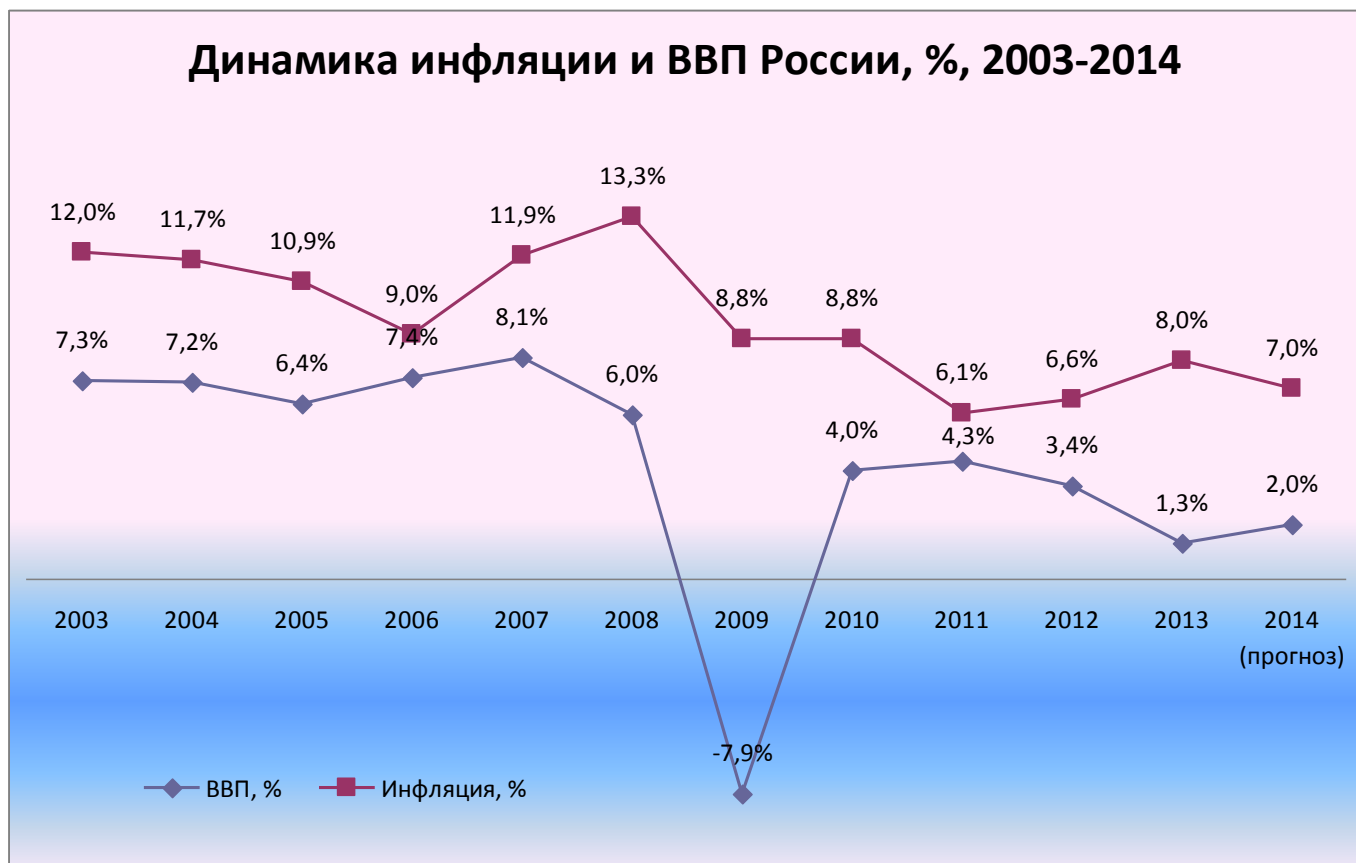
График 1. Динамика инфляции и ВВП России, %, 2003-2014.

График построен на основе данных ФСГС, Минфина, ЦБ РФ, независимых экспертов. По их данным в 2013 г. рост ВВП России оценивается в 1,4% . Ожидаемый рост ВВП в 2014 г. оценивается в диапазоне 1,4% - 2,0 %.