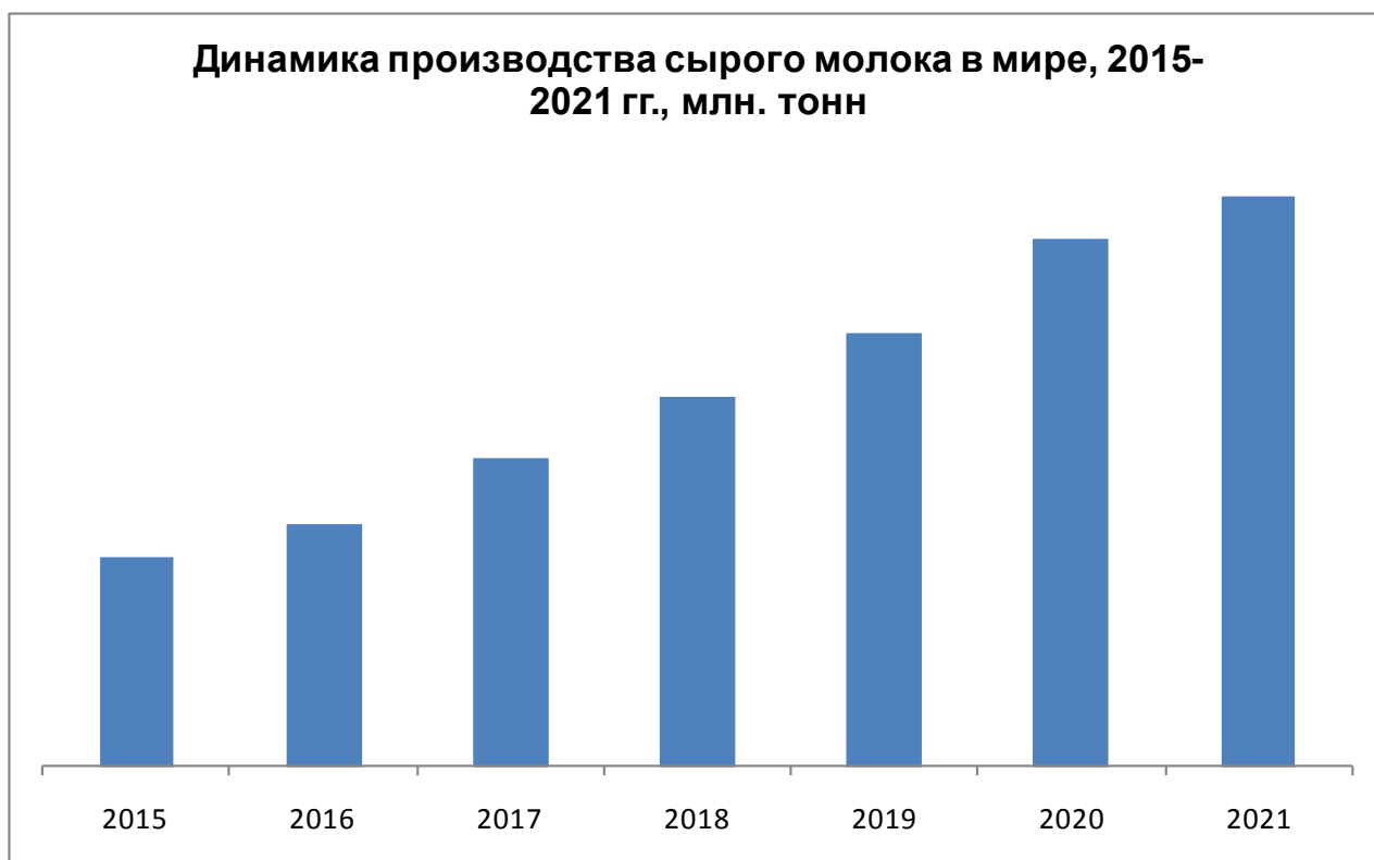
График 1. Динамика производства молока в мире, 2015-2021, млн. тонн.

Отрасль молока и молочной продукции динамично развивается, так как является базовой в структуре пищевой промышленности. В 2021 году производство молока достигло *** млн. тонн. Страны Европы увеличили производство молока до *** млн. тонн. Произошло расширение производства в Европейском Союзе, Российской Федерации и Беларуси.