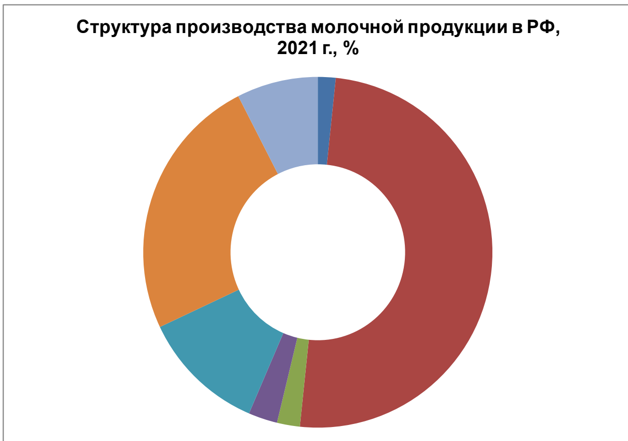
Диаграмма 1. Структура производства молочной продукции в РФ, 2021 г., %.