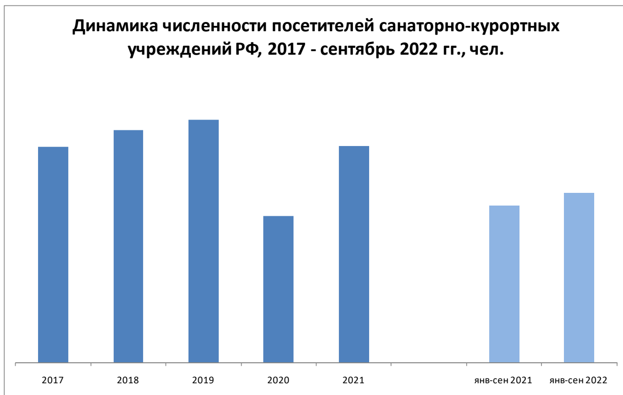
График 1. Динамика численности посетителей санаторно-курортных учреждений РФ, 2017 - сентябрь 2022 гг., чел.