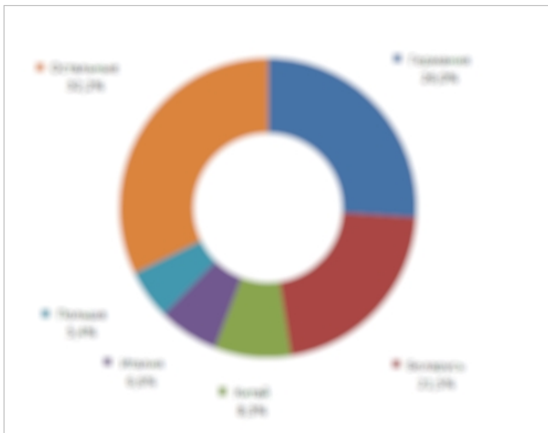
Диаграмма 1. Ведущие страны импорта машин для уборки и обмолота сельхозкультур в РФ, 2021 г.