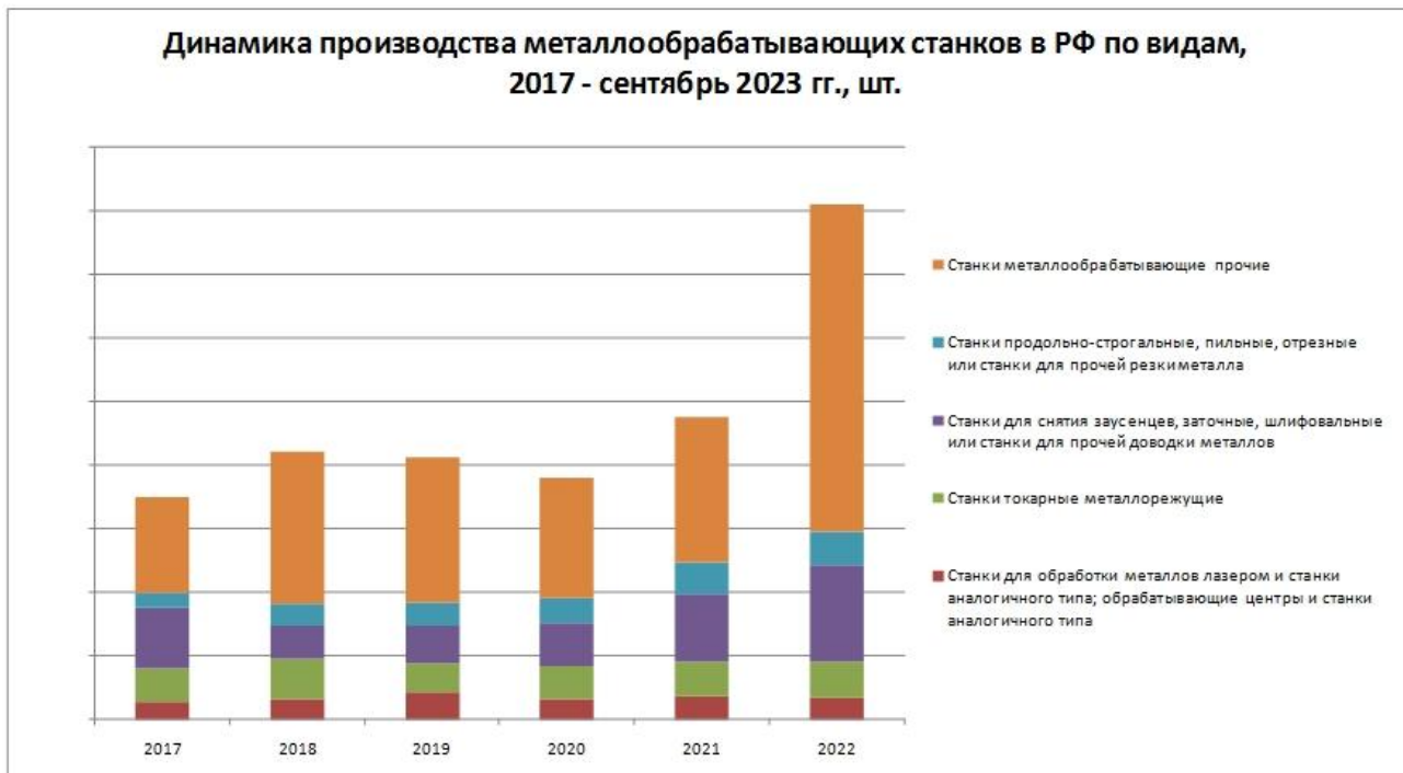
График 1. Прогноз производства металлообрабатывающих станков в РФ, 2017 – сен. 2023 гг., шт.