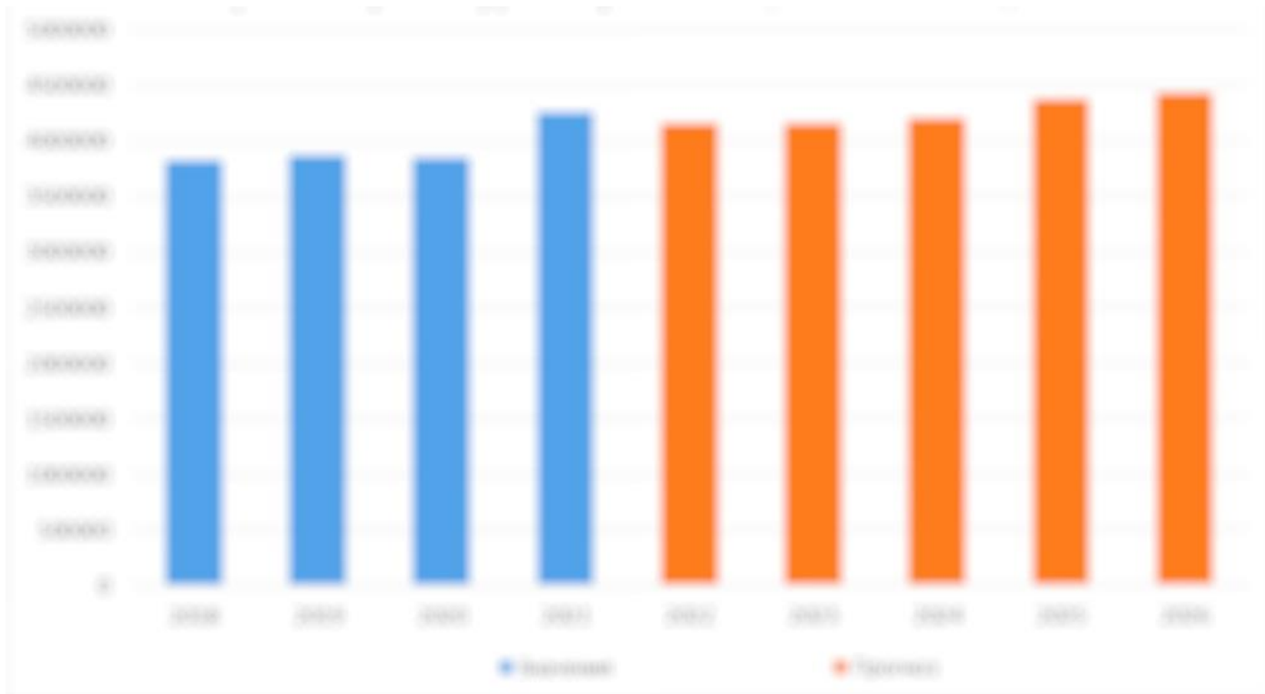
График 1. Прогноз производства деревообрабатывающих станков в РФ, 2022 - 2026 гг., шт.

Источник: собственные расчеты ЭКЦ «Инвест-Проект»