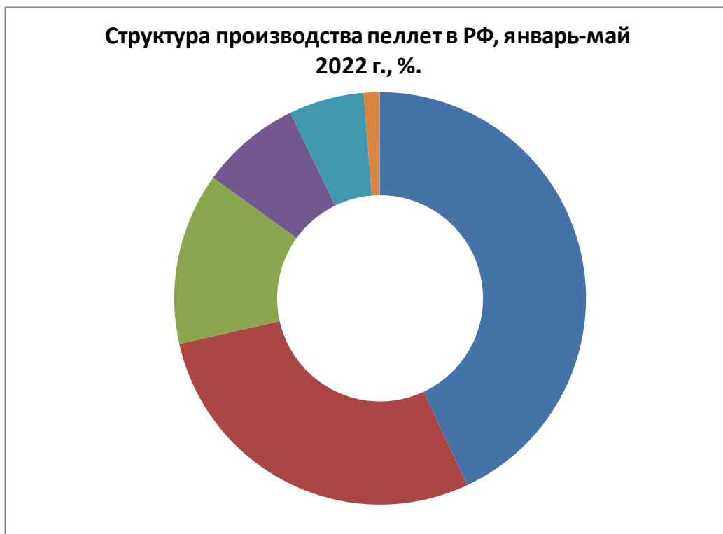
Диаграмма 1 Структура производства пеллет в РФ, январь-май 2022 г., %.