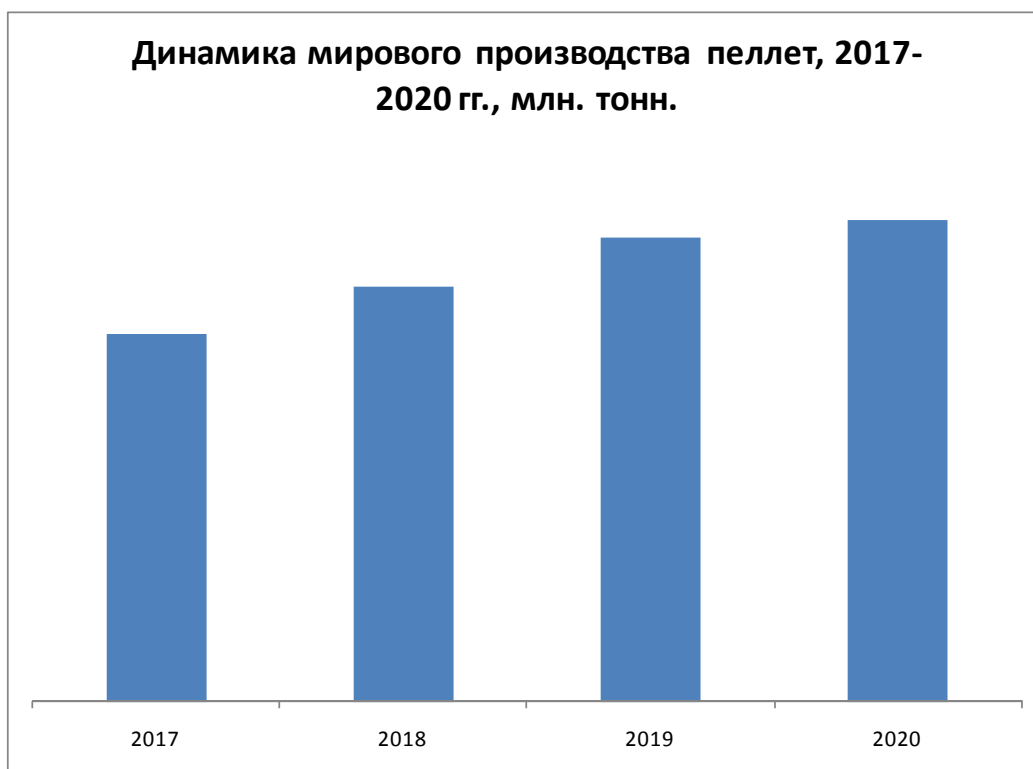
График 1. Динамика мирового производства пеллет, 2017-2020 гг., млн. тонн.