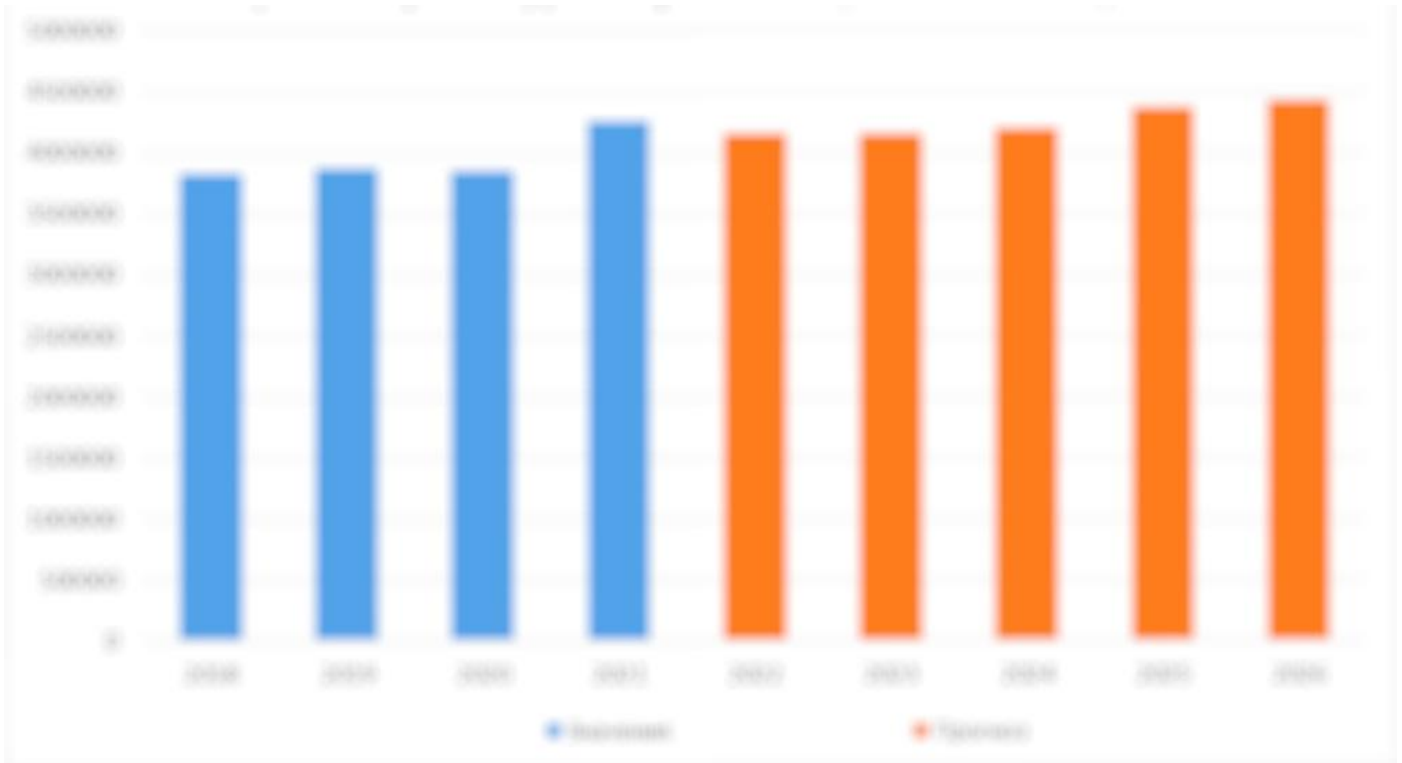
График 1. Прогноз производства ортопедической обуви в РФ, 2022 - 2026 гг., тыс. шт.

Источник: собственные расчеты ЭКЦ «Инвест-Проект»