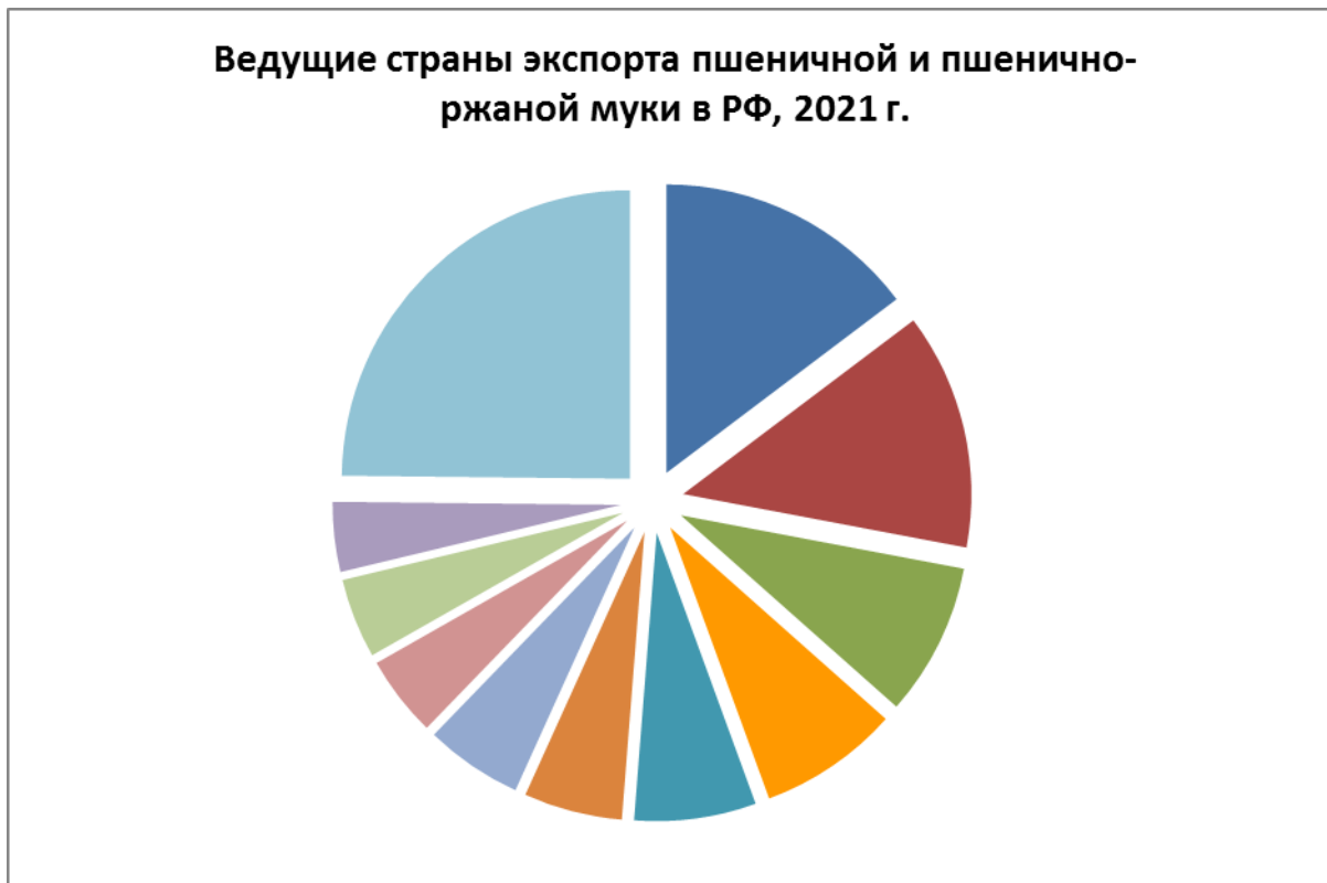
Диаграмма 1. Ведущие страны экспорта пшеничной и пшенично-ржаной муки в РФ, 2021 г.