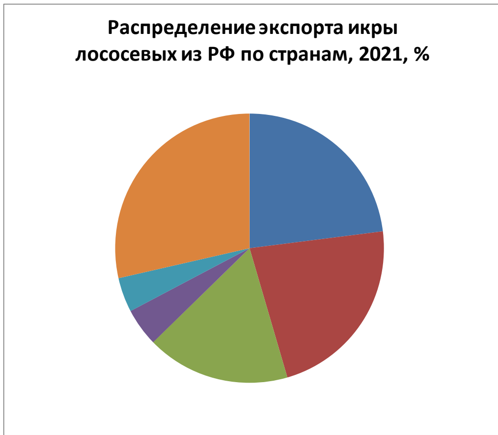
Диаграмма 2. Распределение экспорта икры лососевых из РФ по странам, 2021, %.