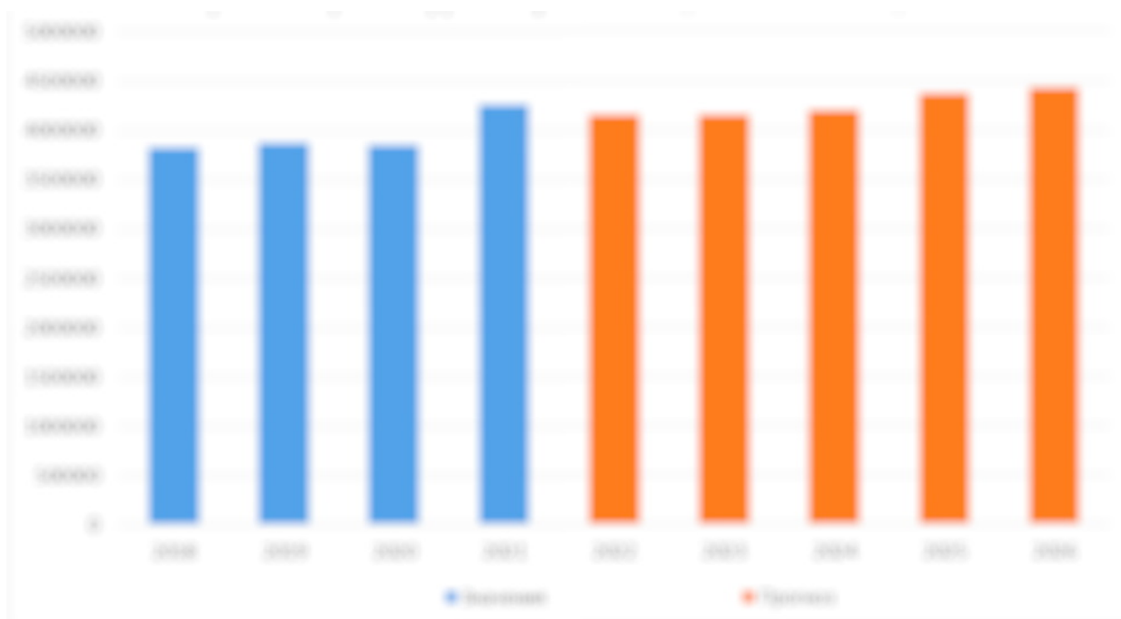
График 1. Прогноз производства икры в РФ до 2026 гг., тн.